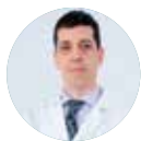
Gonzalo Samitier (Spain)