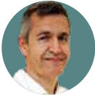
Joan Minguell Hospital Vall d'Hebron