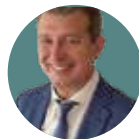
José A. Hernández Hermoso Hospital Germans Trias i Pujol