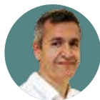
Joan Minguell Hospital Vall d'Hebron