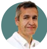
Joan Minguell Hospital Vall d'Hebron