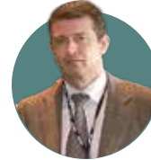
José A. Hernández Hermoso Hospital Germans Trias i Pujol