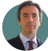
Joan Carles Monllau Parc de Salut Mar